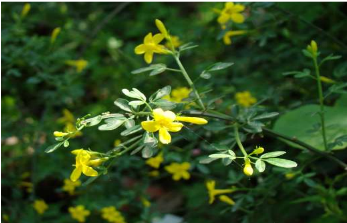
ΦΩΤ.6 Το σπάνιο είδος Jasminum fruticans