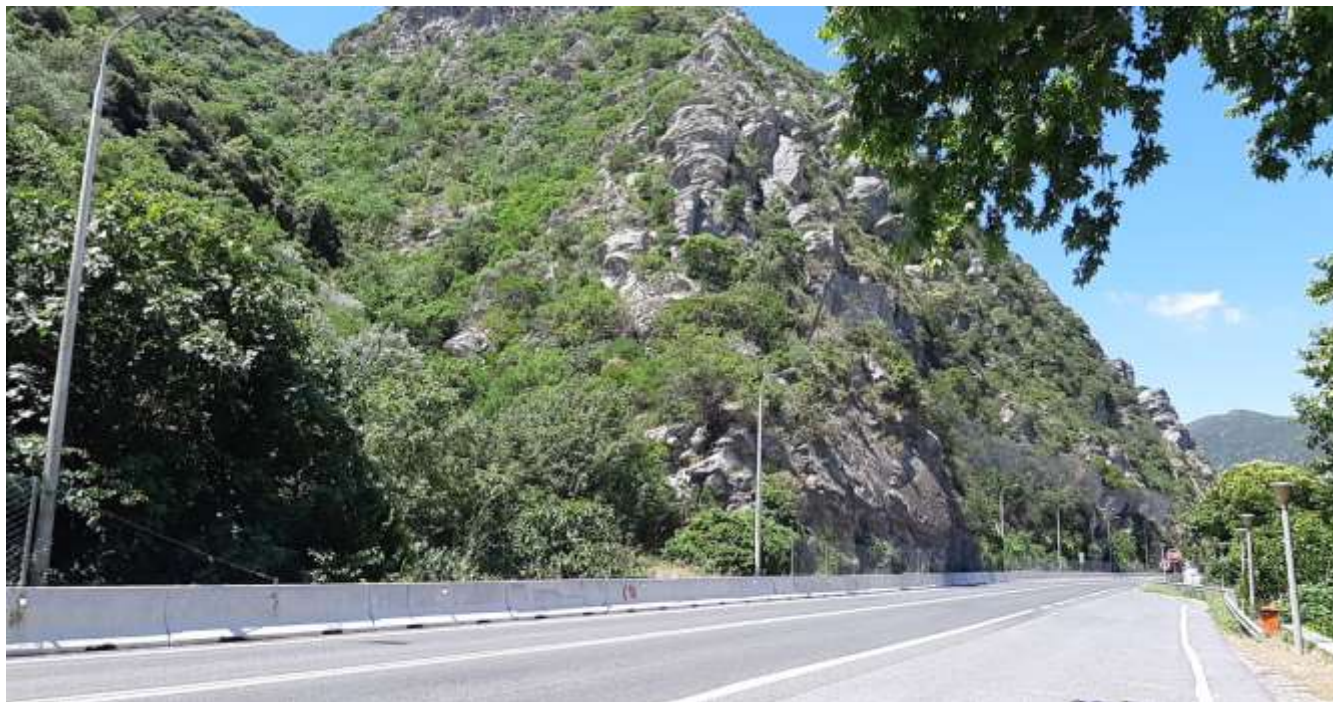
Φωτ. 6.2 : Τμήμα 6 – Μετά τις εργασίες προστασίας (Ιούνιος 2021)