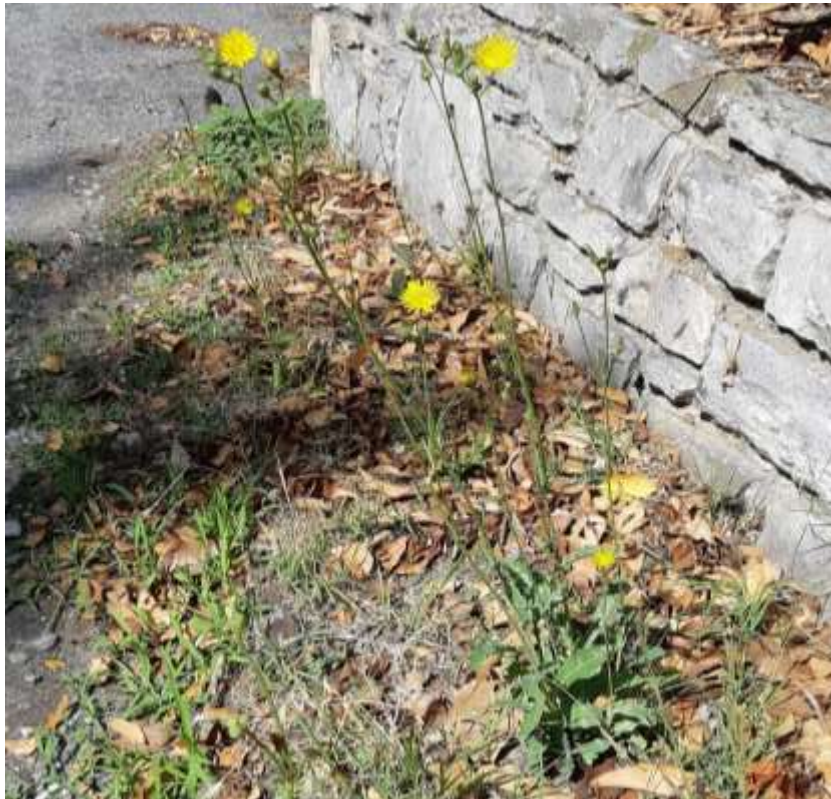
Φωτ.27 Το είδος Sonchus arvensis.