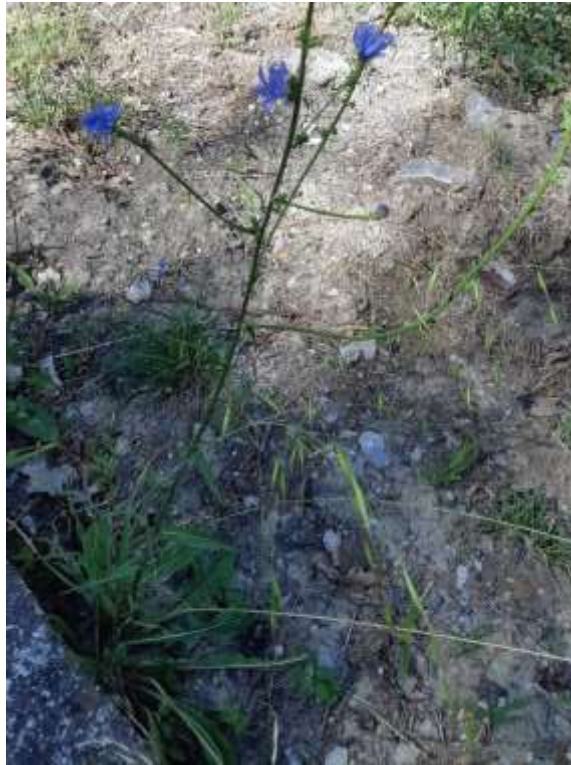
Φωτ.28 Το είδος Cichorium intybus .