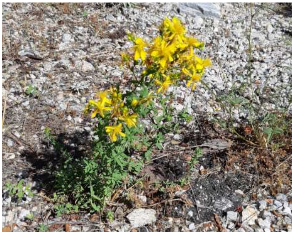
Φωτ.30 Το είδος Hypericum perforatum .