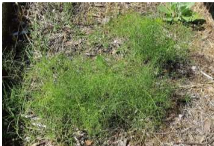
Φωτ.31 Το είδος Ferula communis : φύλλωμα (αριστερά) και καρποί μετά το τέλος της άνθησης (δεξιά).