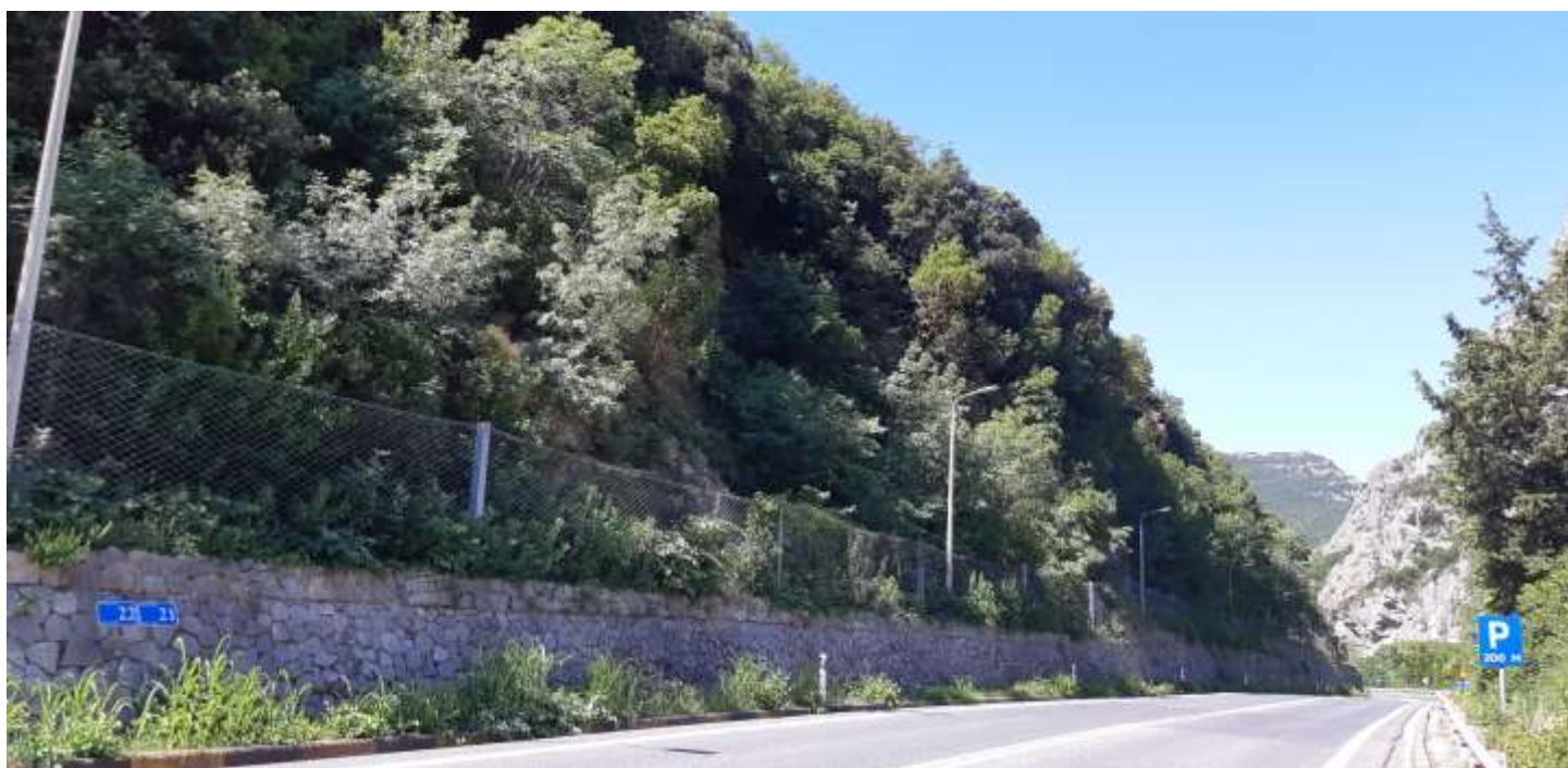
Φωτ. 21.2: Τμήμα 21 – Μετά τις εργασίες προστασίας (Ιούνιος 2021)