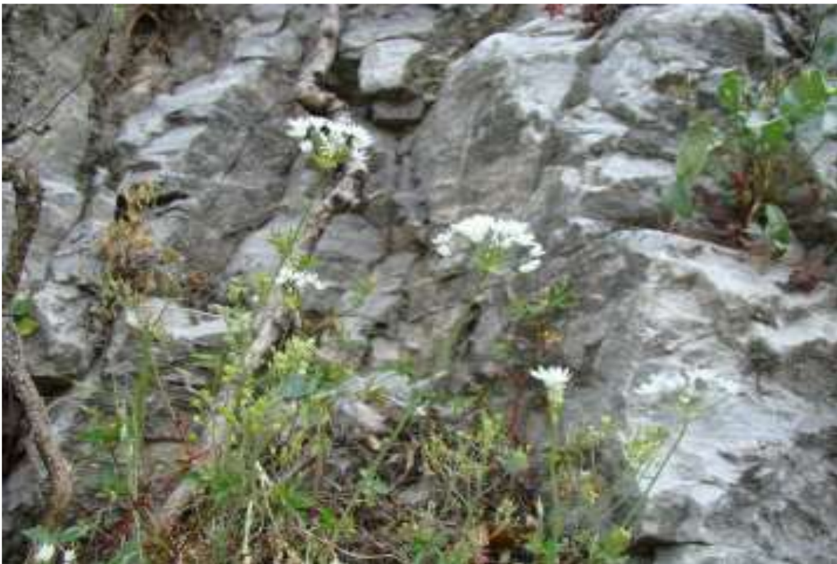
Φωτ.2 Το είδος Allium subhirsutum