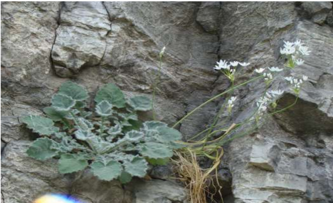
Φωτ.4 Campanula sp. σε οικότοπο 8216 (Ασβεστολιθικά πρηνή με χασμοφυτική βλάστηση)