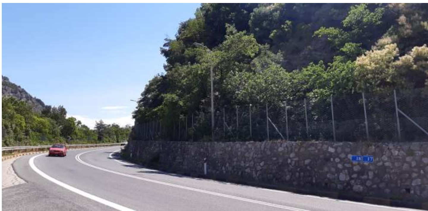
Φωτ. 18.2 : Τμήμα 18 – Μετά τις εργασίες προστασίας (Ιούνιος 2021)