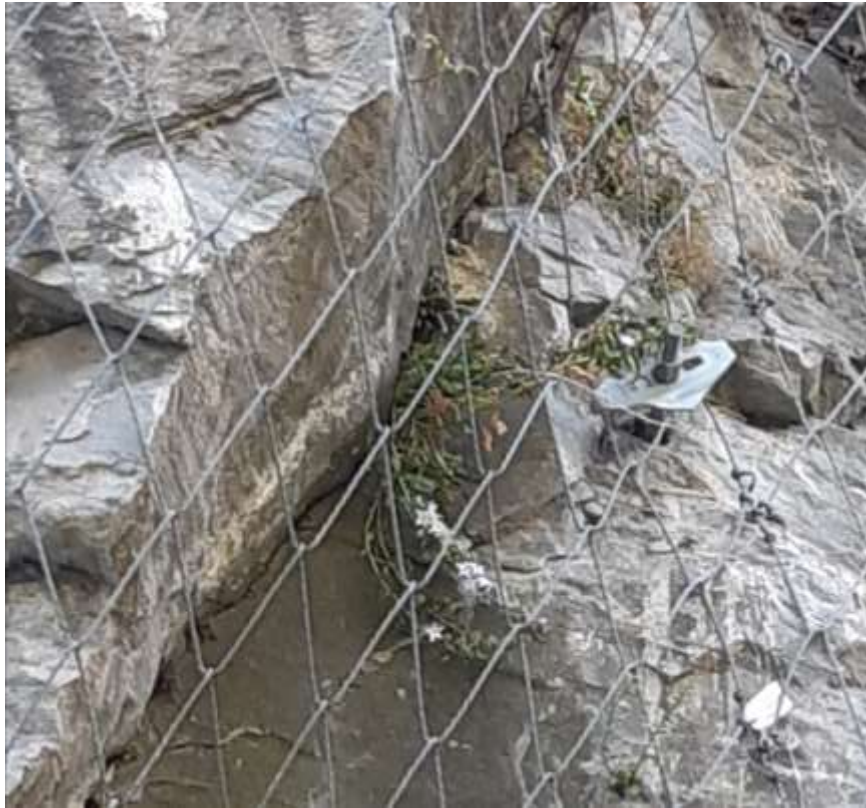
Φωτ.14 Το ενδημικό είδος Campanula betulifolia .