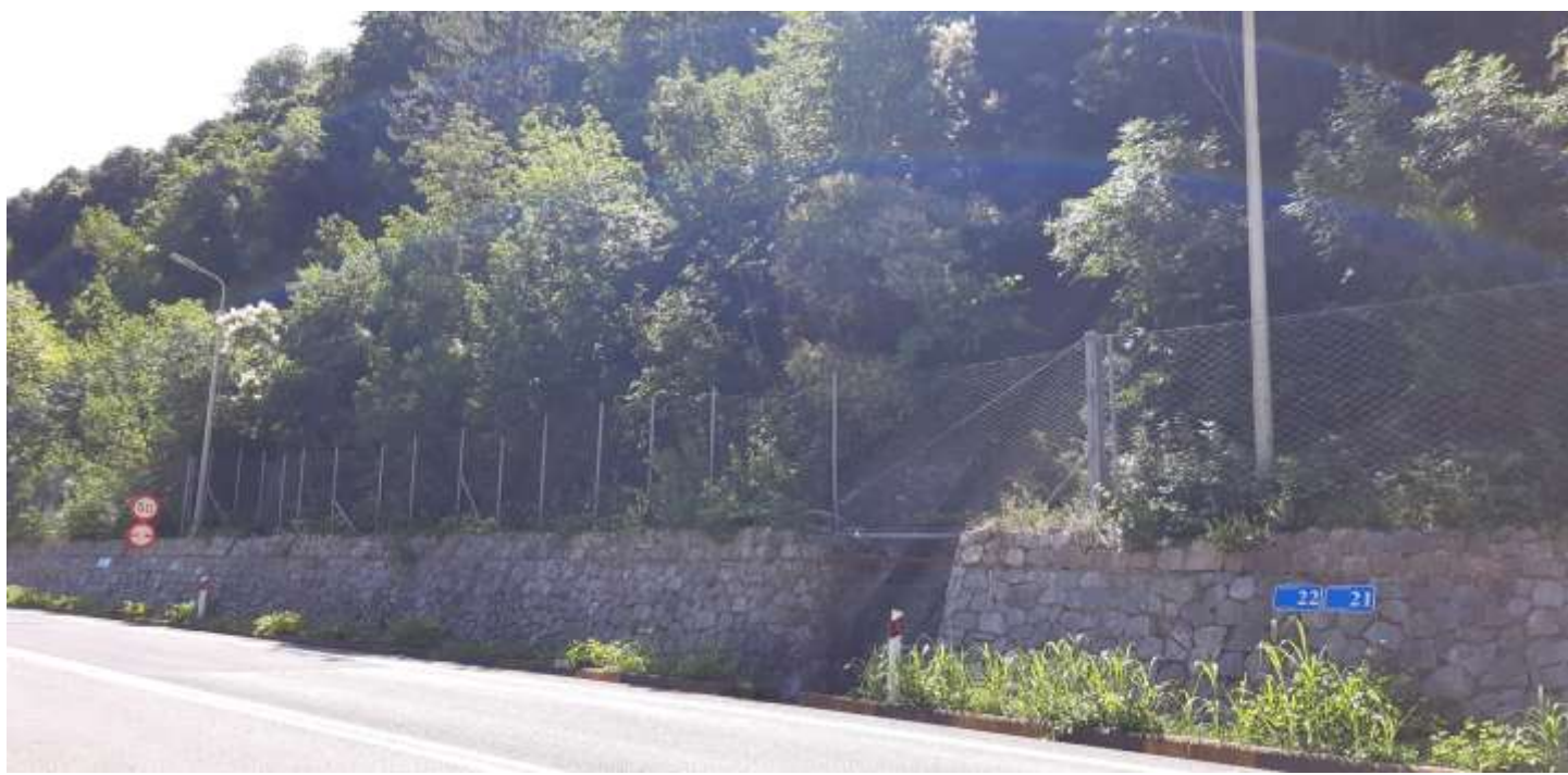
Φωτ. 22.2 : Τμήμα 22 – Μετά τις εργασίες προστασίας (Ιούνιος 2021)