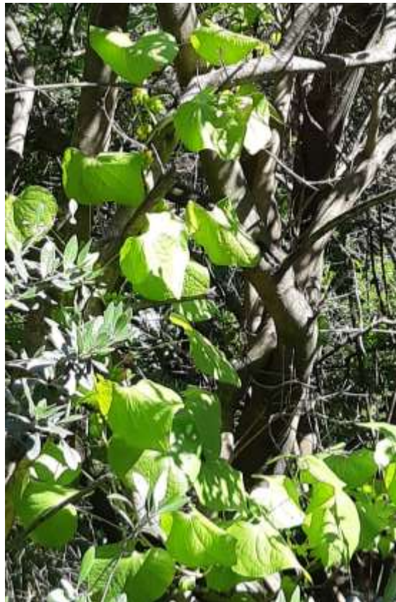
Φωτ.33 Το είδος Dioscorea communis .