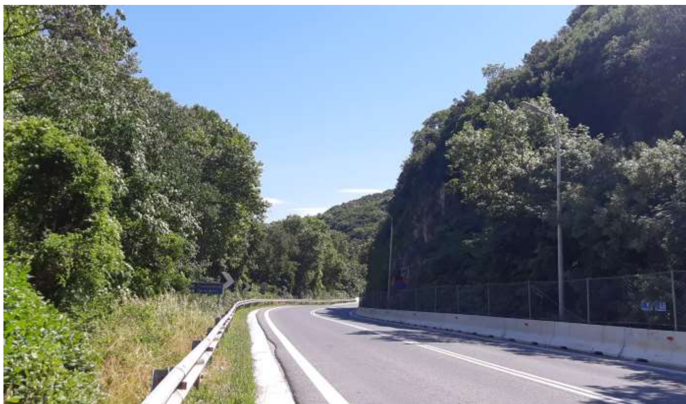
Φωτ. 14.2 : Τμήμα 14 – Μετά τις εργασίες προστασίας (Ιούνιος 2021)