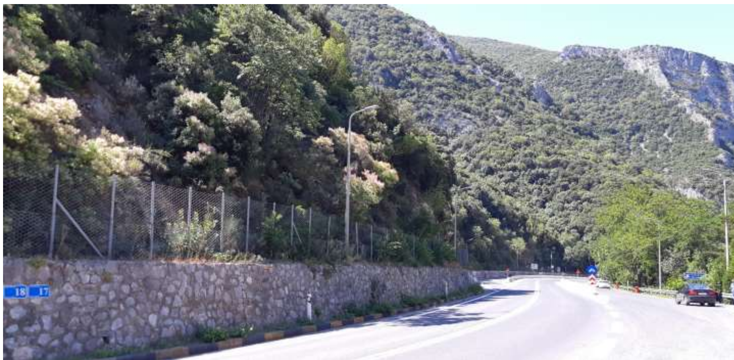
Φωτ. 17.2 : Τμήμα 17 – Μετά τις εργασίες προστασίας (Ιούνιος 2021)