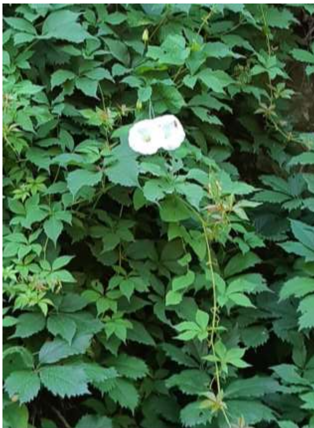
Φωτ.22 Το αναρριχώμενο είδος Calystegia sepium .