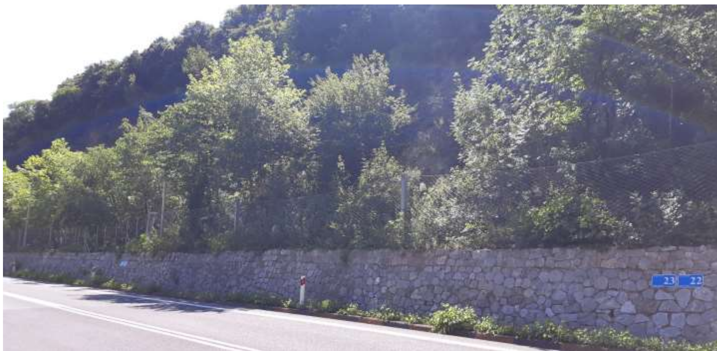
Φωτ. 23.3 : Τμήμα 23 – Μετά τις εργασίες προστασίας (Ιούνιος 2021)