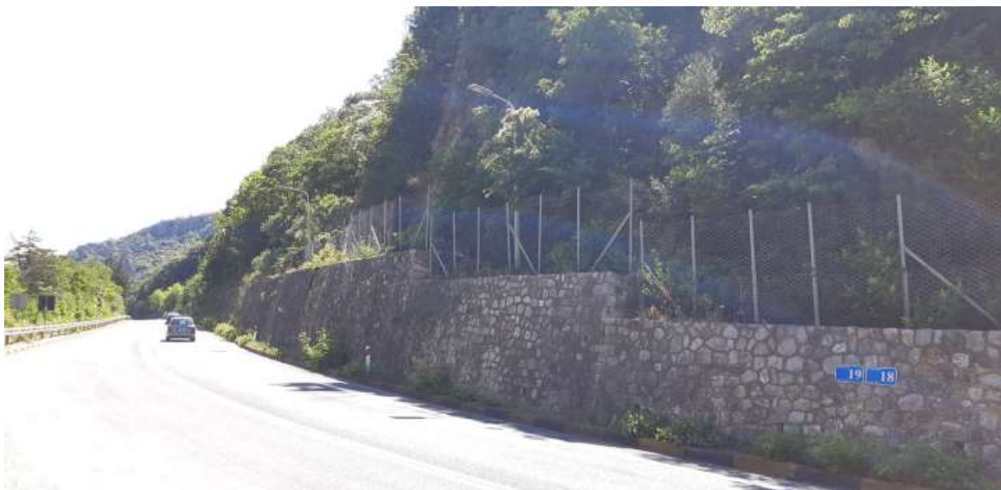
Φωτ. 19.2 : Τμήμα 19 – Μετά τις εργασίες προστασίας (Ιούνιος 2021)