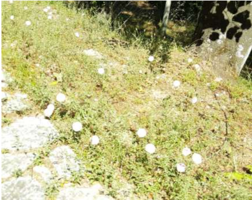
Φωτ.32 Το είδος Convolvulus arvensis .