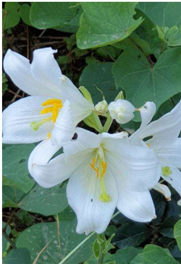
Φωτ.18 Το ενδημικό είδος Lilium candidum στα ηρανή του Πηνειού.