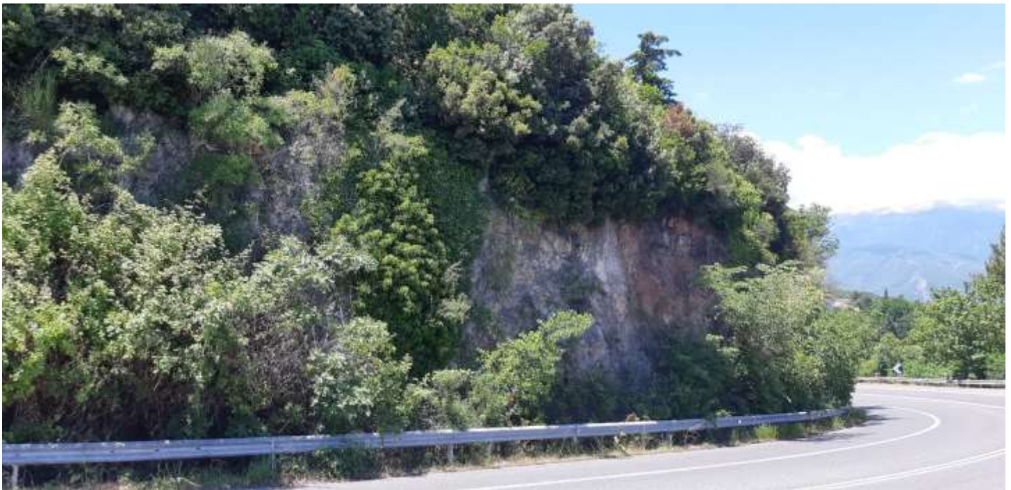
Φωτ. 1.4 : Τμήμα 1 – Μετά τις εργασίες προστασίας (Ιούνιος 2021)