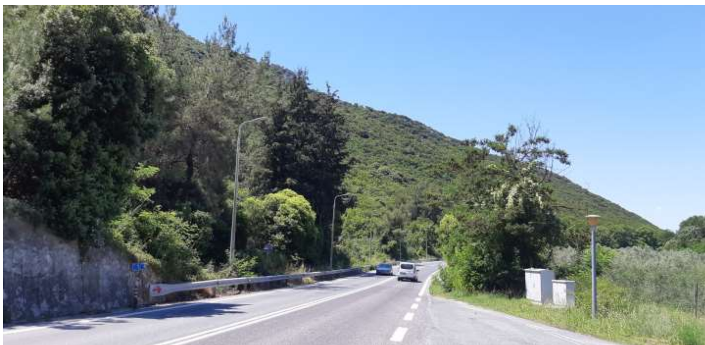
Φωτ. 1.2: Τμήμα 1 – Μετά τις εργασίες προστασίας (Ιούνιος 2021)