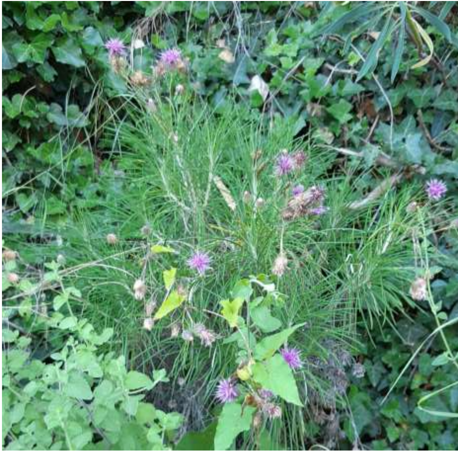
ΦΩΤ.24 Το είδος Ptilostema chamaepeuce .