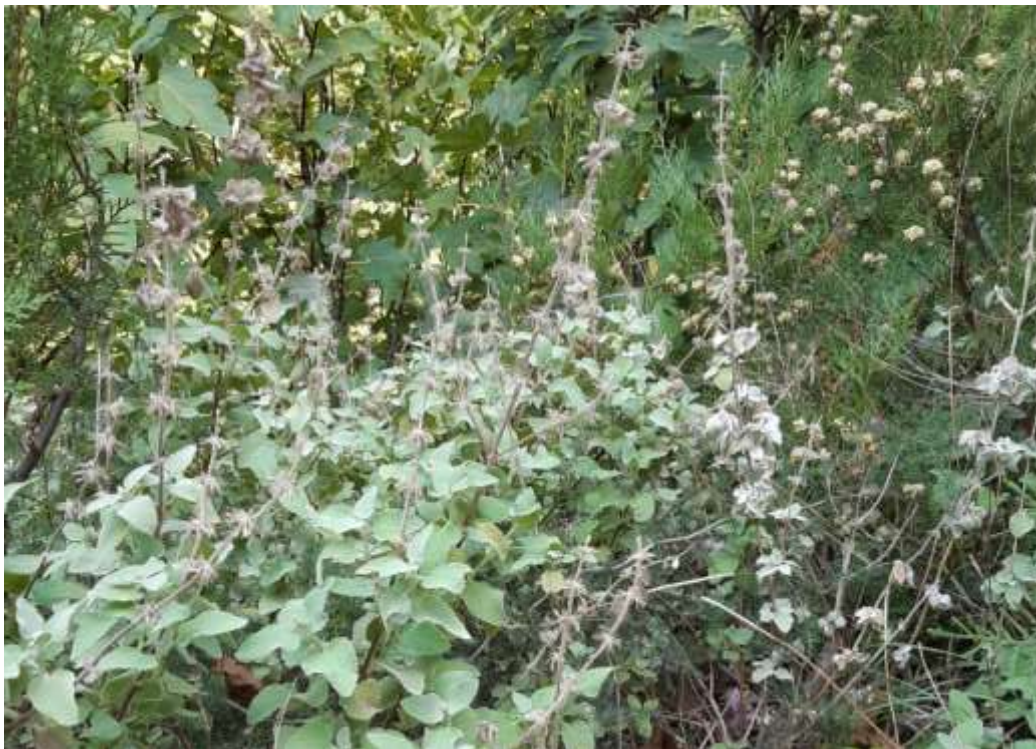
Φωτ.15 Το ενδημικό είδος Balota acetabulosa .