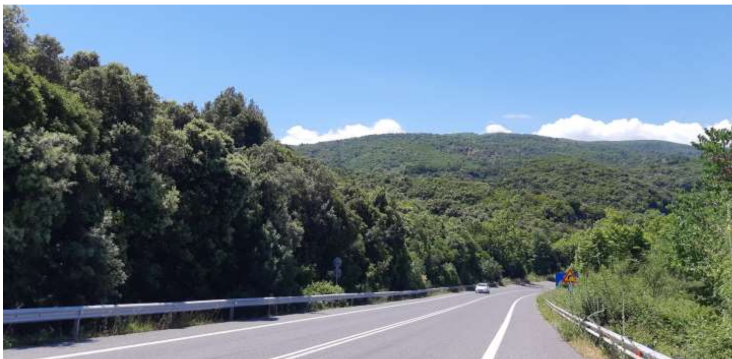
Φωτ. 2.2 : Τμήμα 2 - Μετά τις εργασίες προστασίας (Ιούνιος 2021)