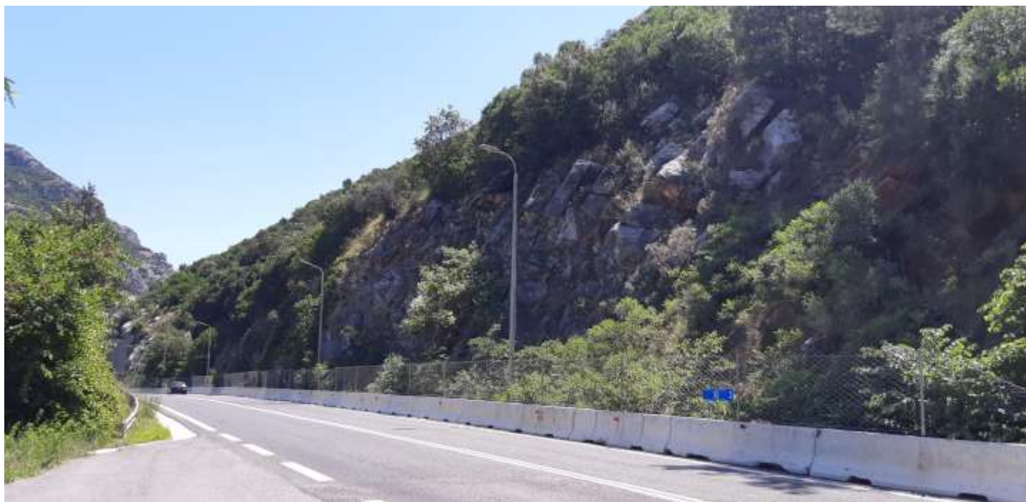
Φωτ. 3.2 : Τμήμα 3 – Μετά τις εργασίες προστασίας (Ιούνιος 2021)