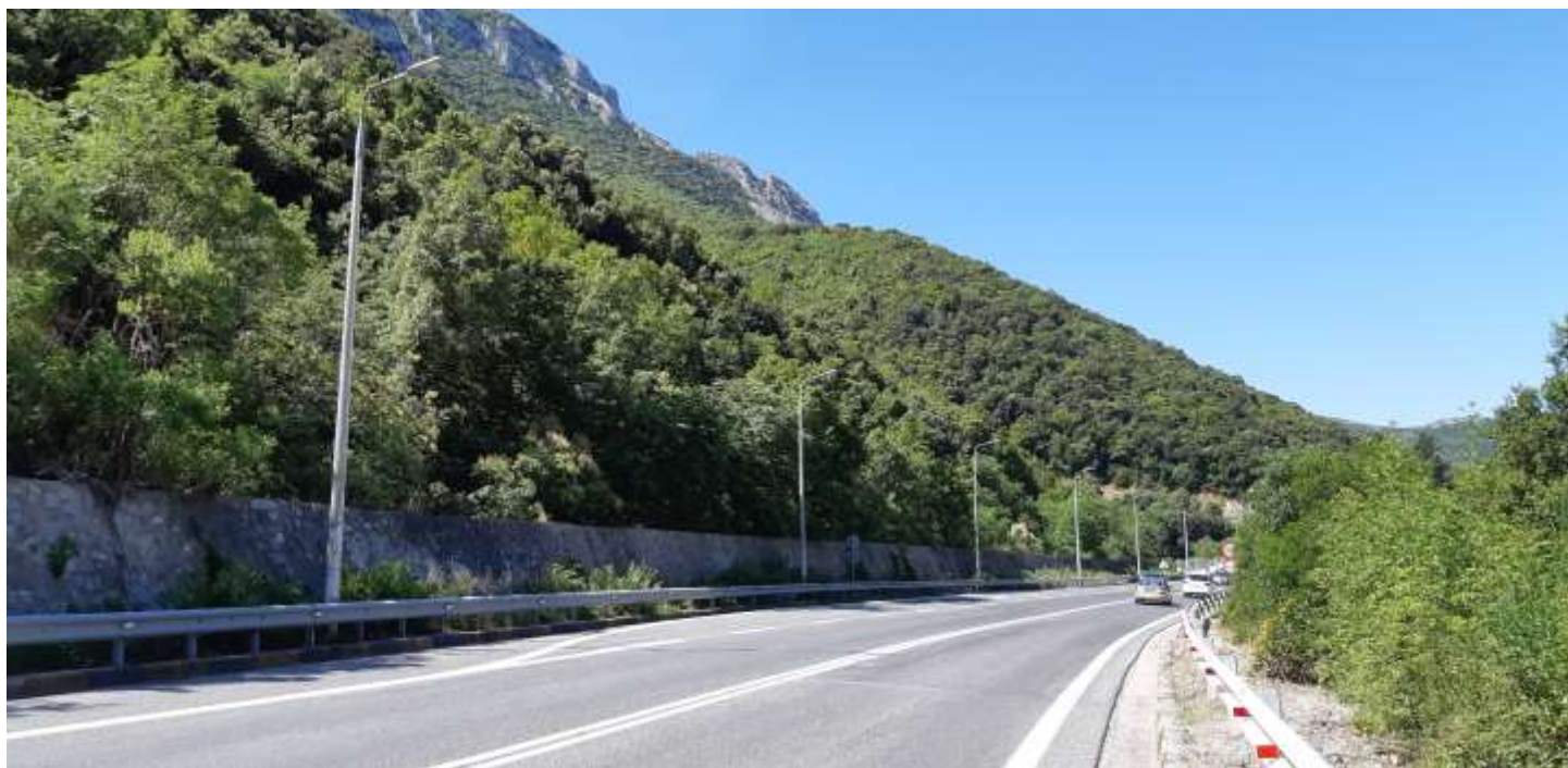
Φωτ. 26.2 : Τμήμα 26 – Μετά τις εργασίες προστασίας (Ιούνιος 2021)