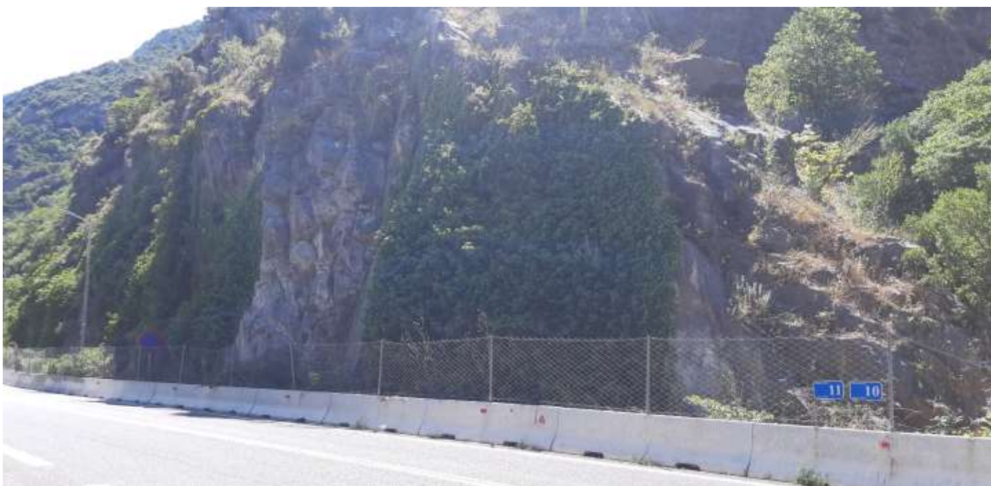
Φωτ. 11.2: Τμήμα 11 – Μετά τις εργασίες προστασίας (Ιούνιος 2021)