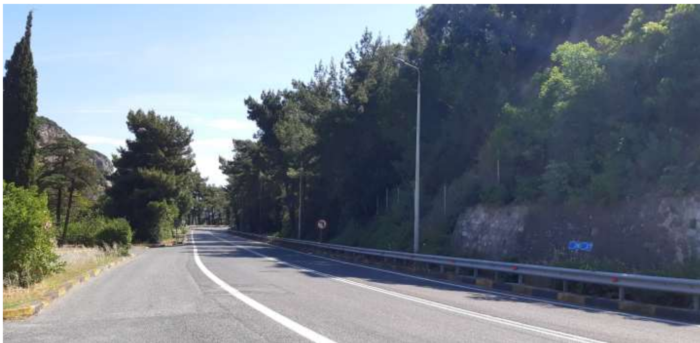
Φωτ. 28.2 : Τμήμα 28 – Μετά τις εργασίες προστασίας (Ιούνιος 2021)