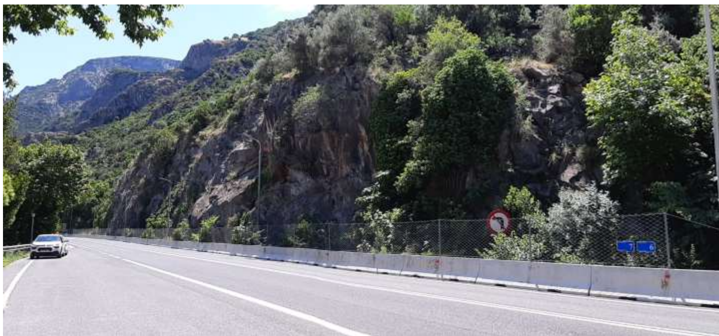
Φωτ. 7.2 : Τμήμα 7 – Μετά τις εργασίες προστασίας (Ιούνιος 2021)