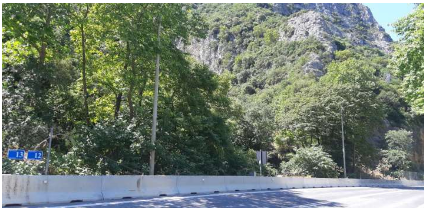
Φωτ. 12.2 : Τμήμα 12 – Μετά τις εργασίες προστασίας (Ιούνιος 2021)