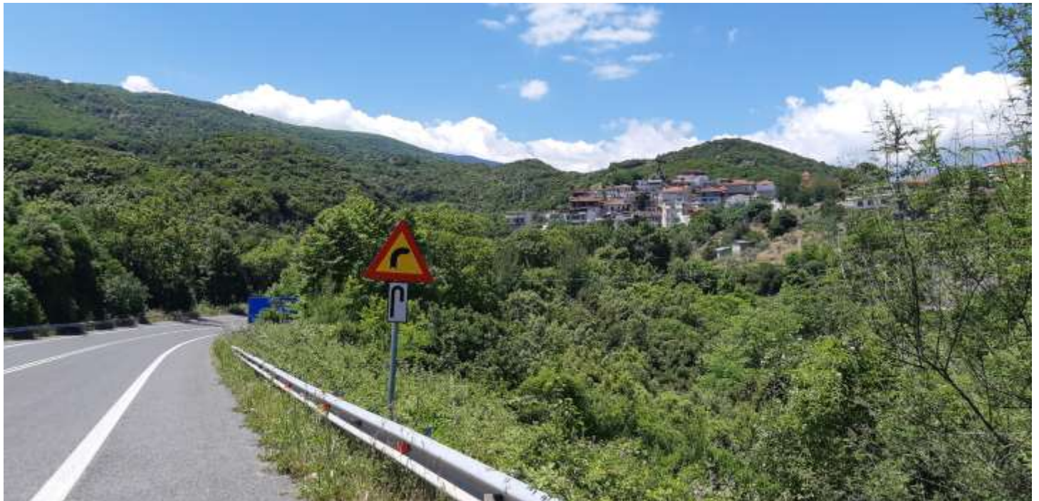
Φωτ. 2.4 : Τμήμα 2 – Μετά τις εργασίες προστασίας (Ιούνιος 2020 - Ιούνιος 2021)