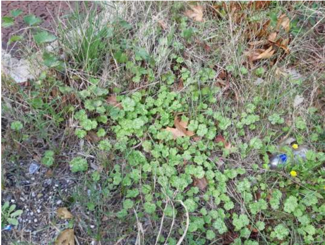
Φωτ.11 Το ενδημικό είδος Geranium purpureum