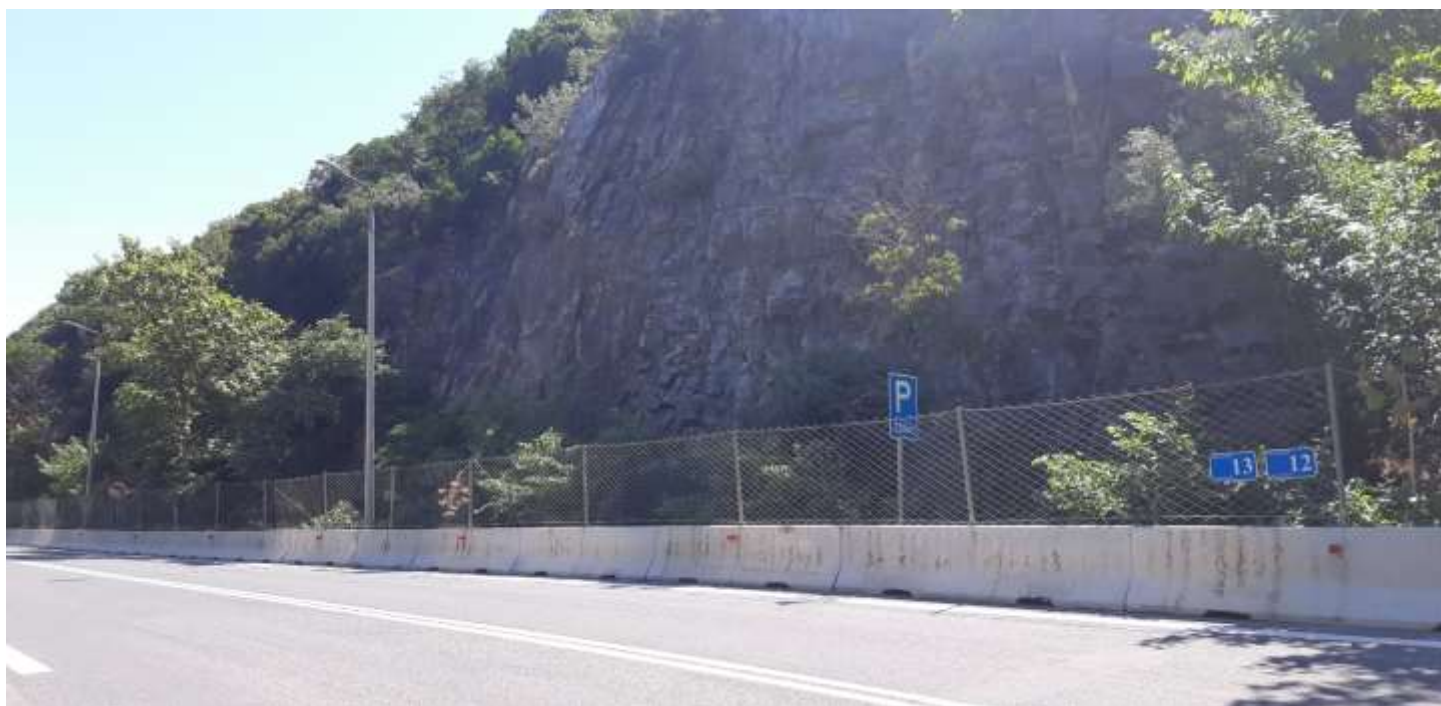
Φωτ. 13.2 : Τμήμα 13 – Μετά τις εργασίες προστασίας (Ιούνιος 2021)