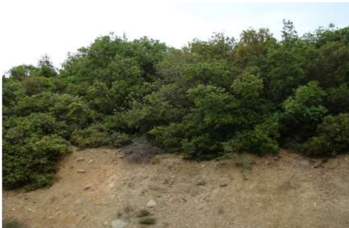
Φωτ.10 Άποψη μακκίας βλάστησης (5350)