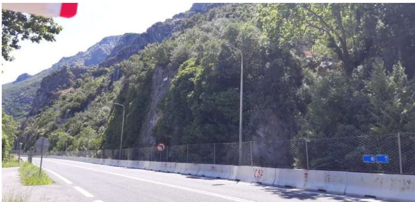
Φωτ. 8.2 : Τμήμα 8 – Μετά τις εργασίες προστασίας (Ιούνιος 2021)