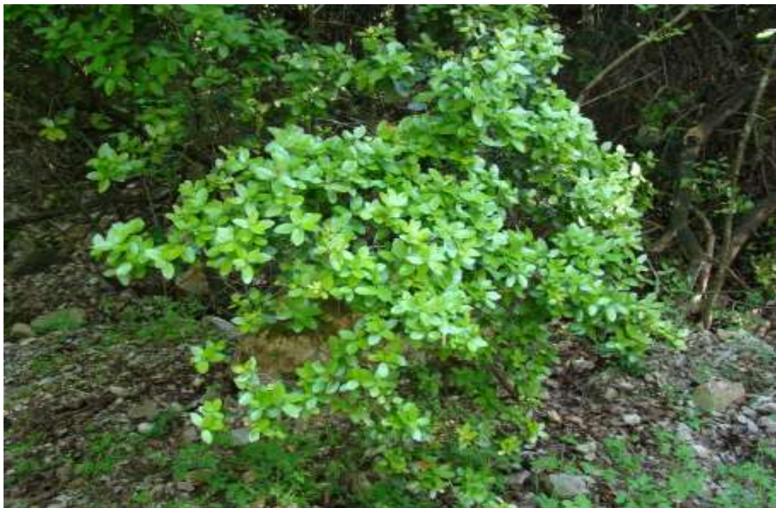
ΦΩΤ. 8 Το είδος Rhamnus alaternus