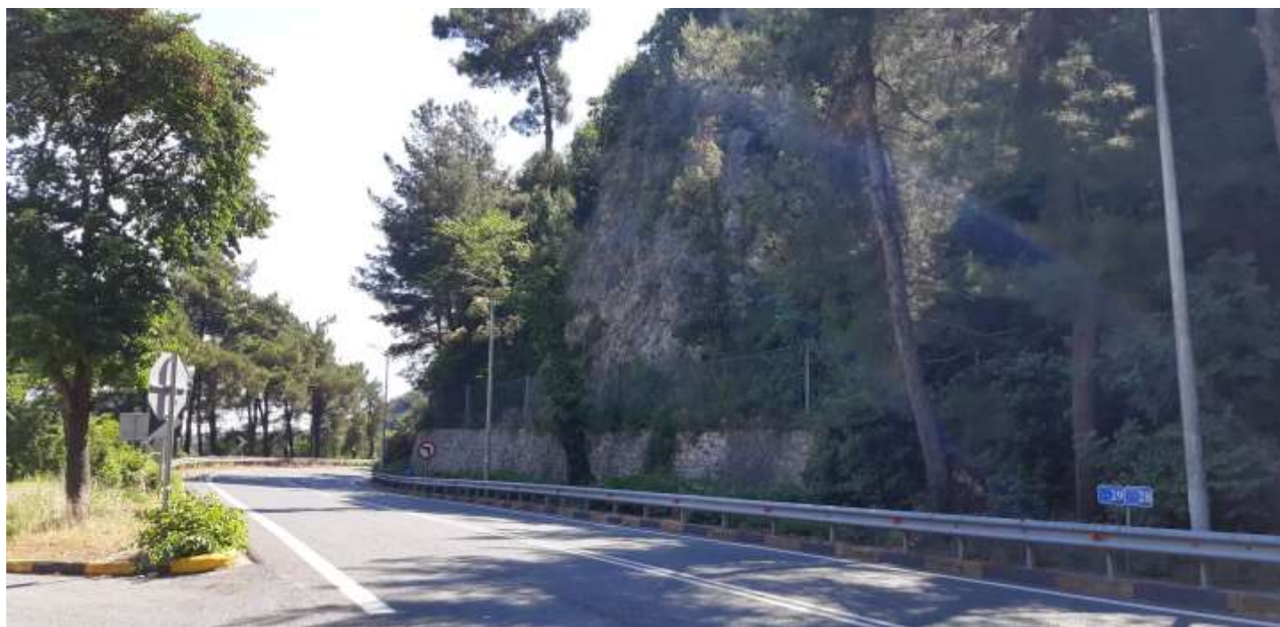
Φωτ. 29.2 : Τμήμα 29 – Μετά τις εργασίες προστασίας (Ιούνιος 2021)