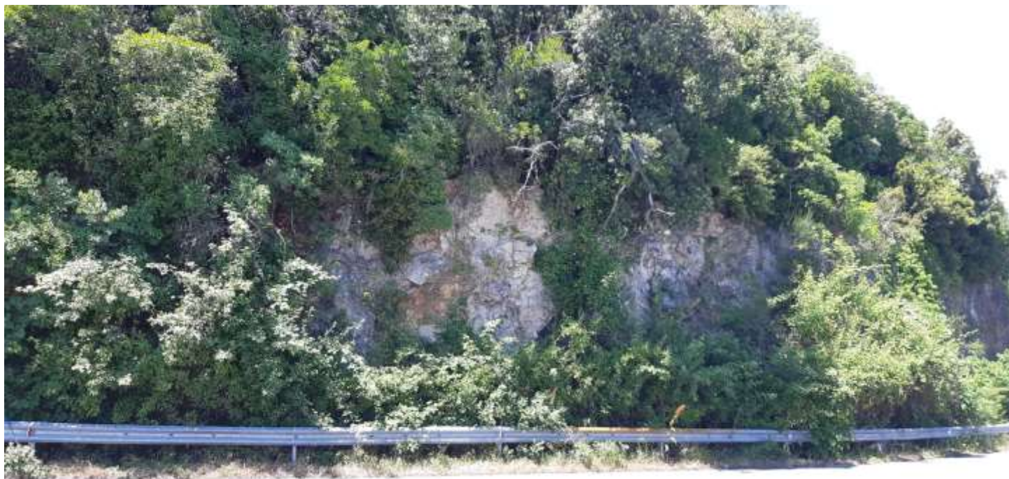
Φωτ. 1.2 : Τμήμα 1 - Ιούνιος 2021