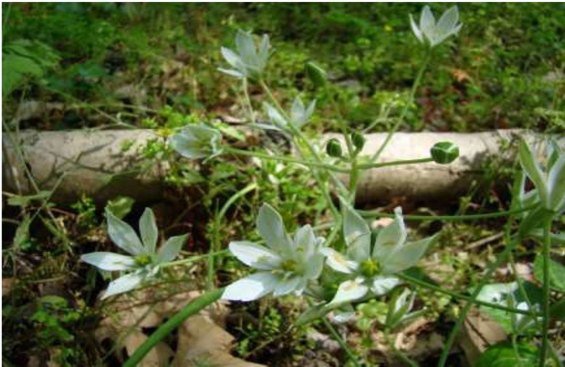
ΦΩΤ.7 Το είδος Ornithogallum umbellatum