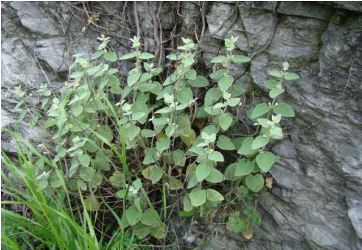
ΦΩΤ.5 Το είδος Balota acetabulosa