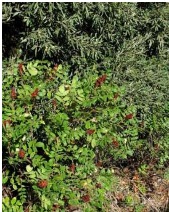
Φωτ.19 Το είδος Rhus coriaria στα ηρανή του Πηνειού.