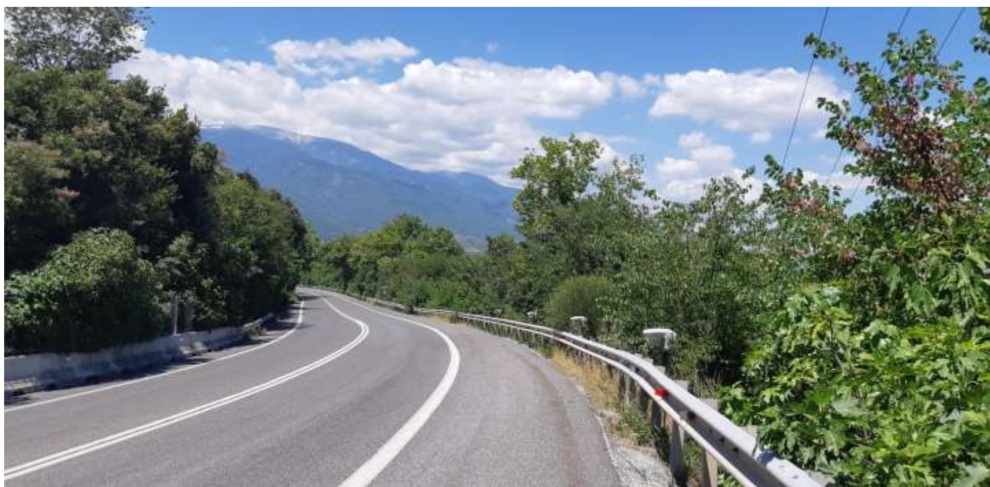
Φωτ. 6.2: Τμήμα 6 – Μετά τις εργασίες προστασίας (Ιούνιος 2021)