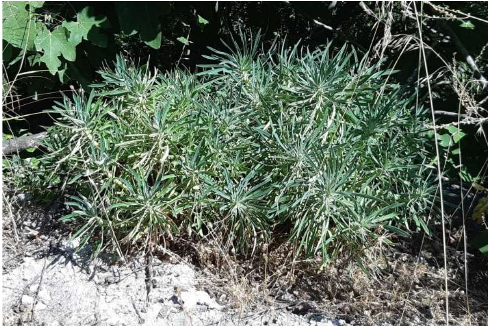
Φωτ.16 Το είδος Euphorbia characias στα πρανή του Πηνειού.