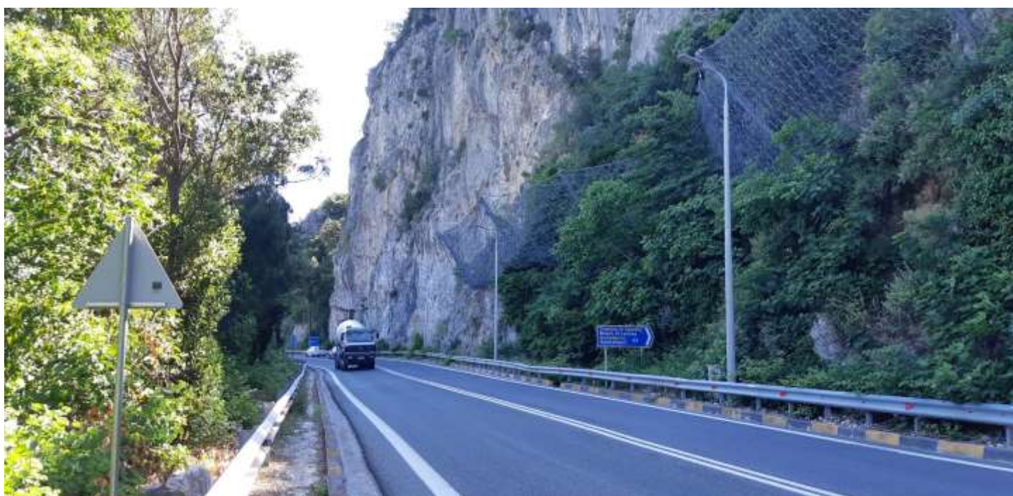
Φωτ. 33.2 : Τμήμα 33 - Μετά τις εργασίες προστασίας (Ιούνιος 2021).