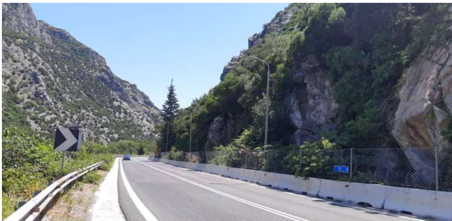
Φωτ. 5.2 : Τμήμα 5 – Μετά τις εργασίες προστασίας (Ιούνιος 2021)