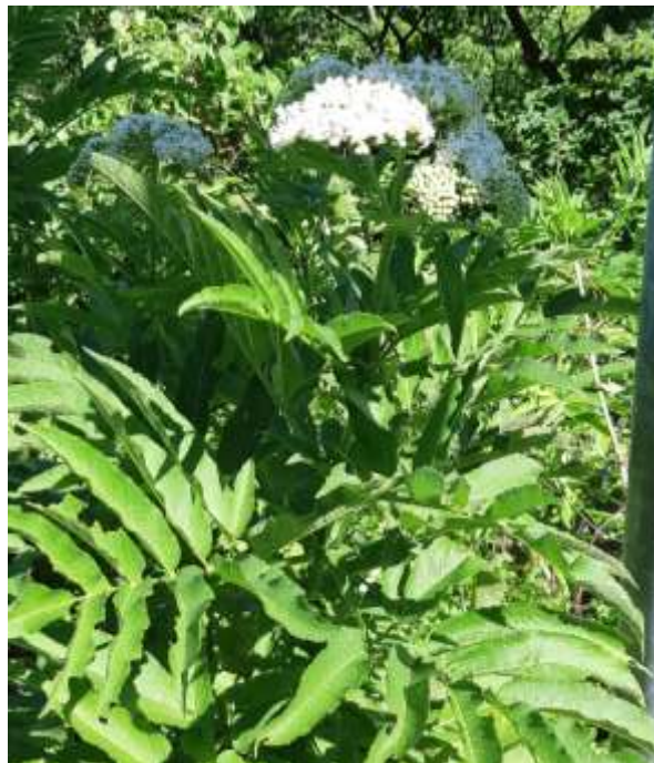
ΦΩΤ.25 Το είδος Sambucus ebulus .