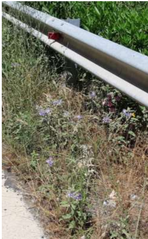
Φωτ.21 Το είδος Solanum elaeagnifolium στα πρανή του Πηνειού.