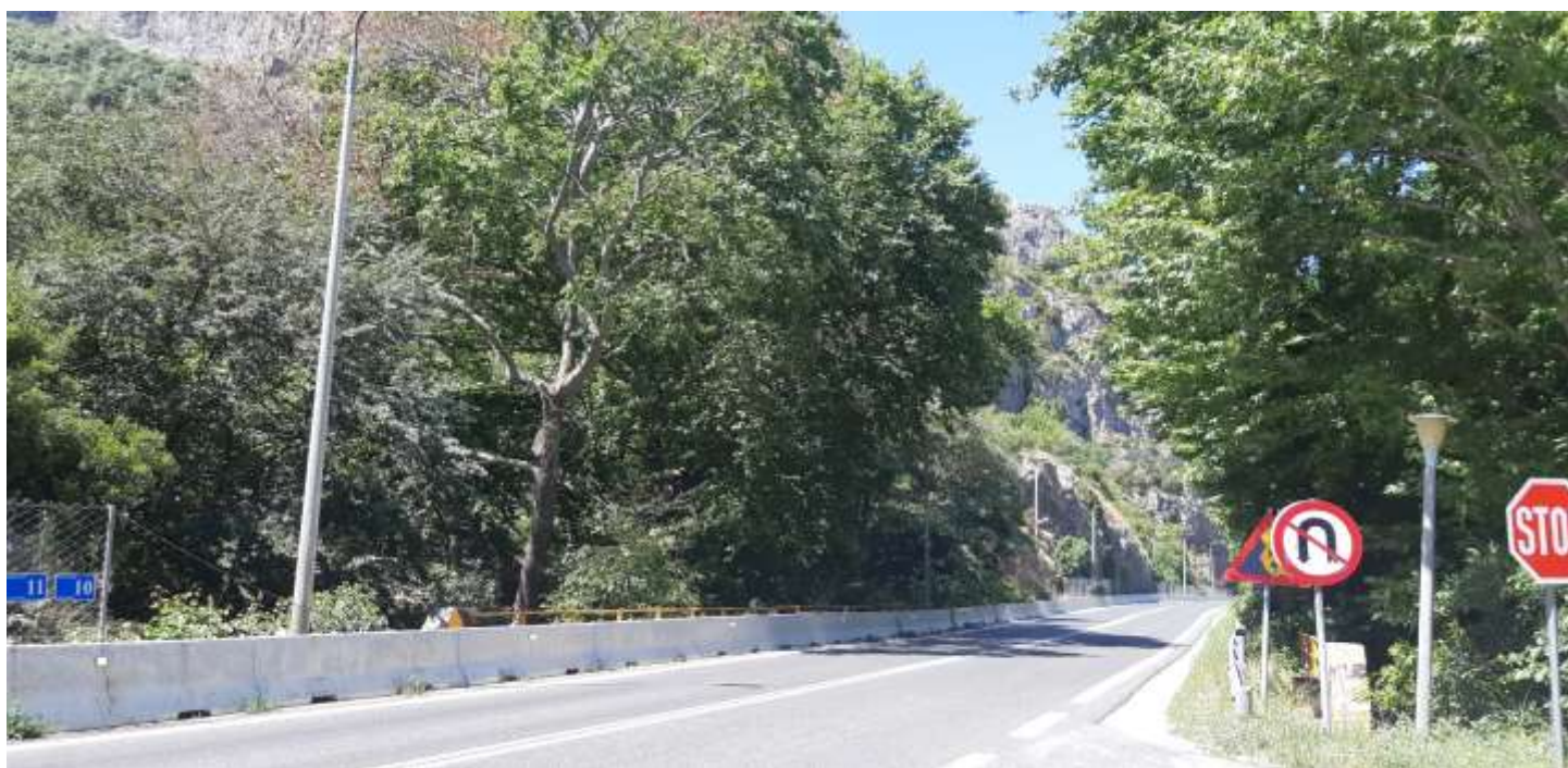
Φωτ. 10.2 : Τμήμα 10 - Μετά τις εργασίες προστασίας (Ιούνιος 2021).