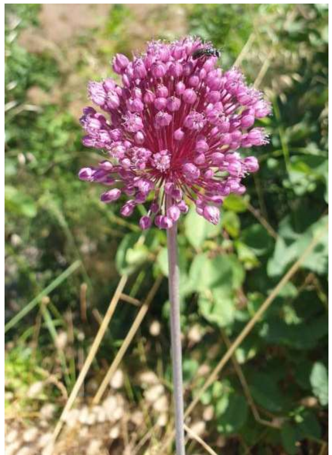
Φωτ.17 Το ενδημικό είδος Allium heldreichii στα πρανή του Πηνειού.