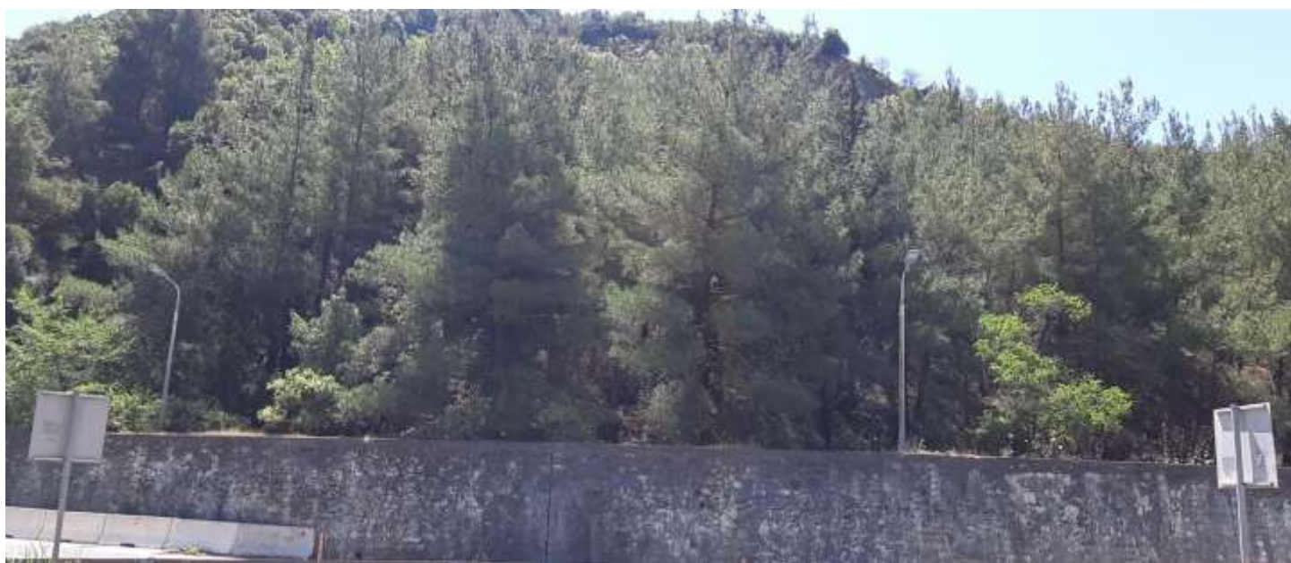
Φωτ. 2.2: Τμήμα 1 – Μετά τις εργασίες προστασίας (Ιούνιος 2021)