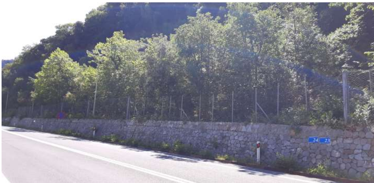
Φωτ. 24.2 : Τμήμα 24 – Μετά τις εργασίες προστασίας (Ιούνιος 2021)