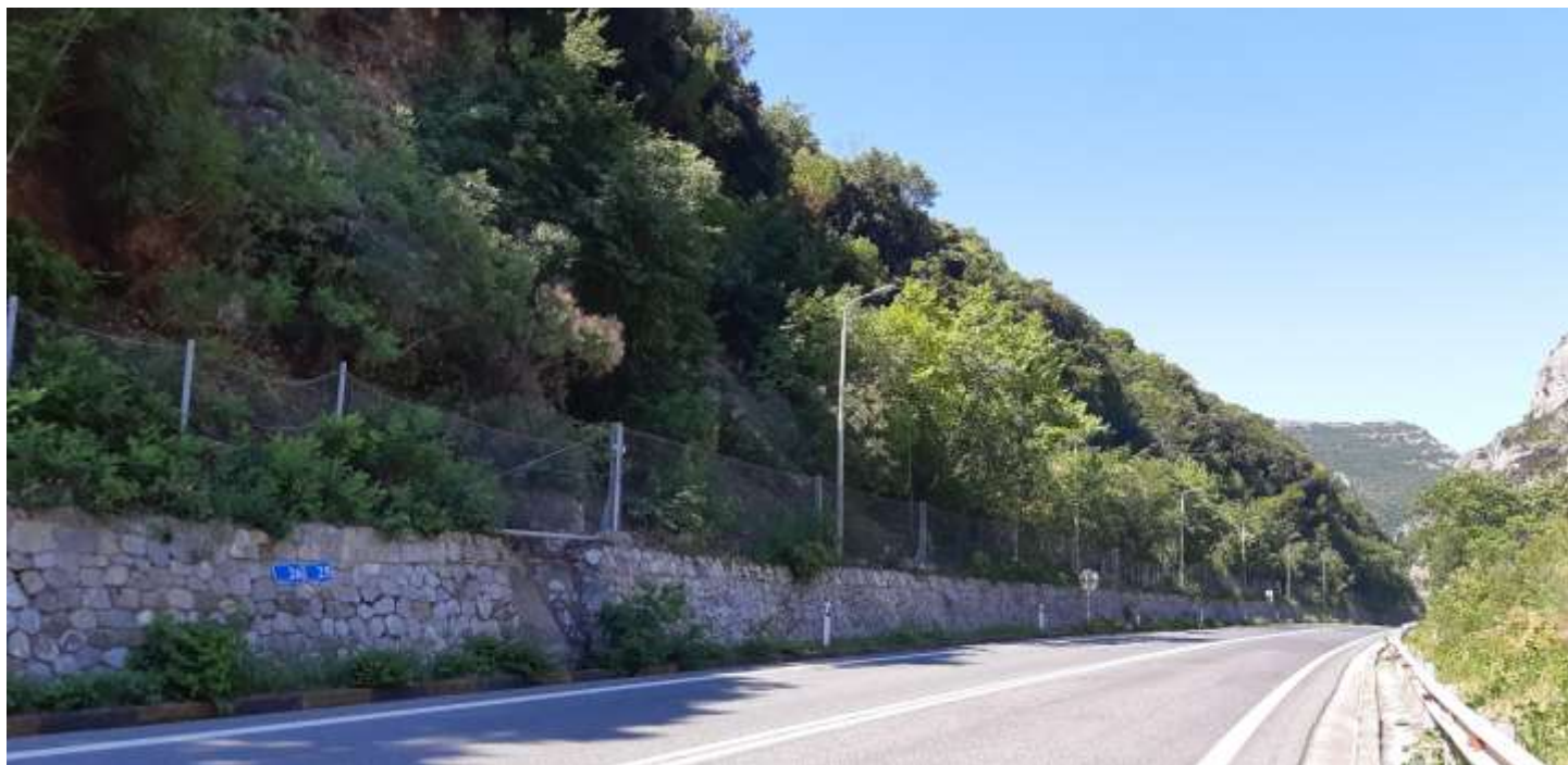
Φωτ. 25.2 : Τμήμα 25 – Μετά τις εργασίες προστασίας (Ιούνιος 2021)