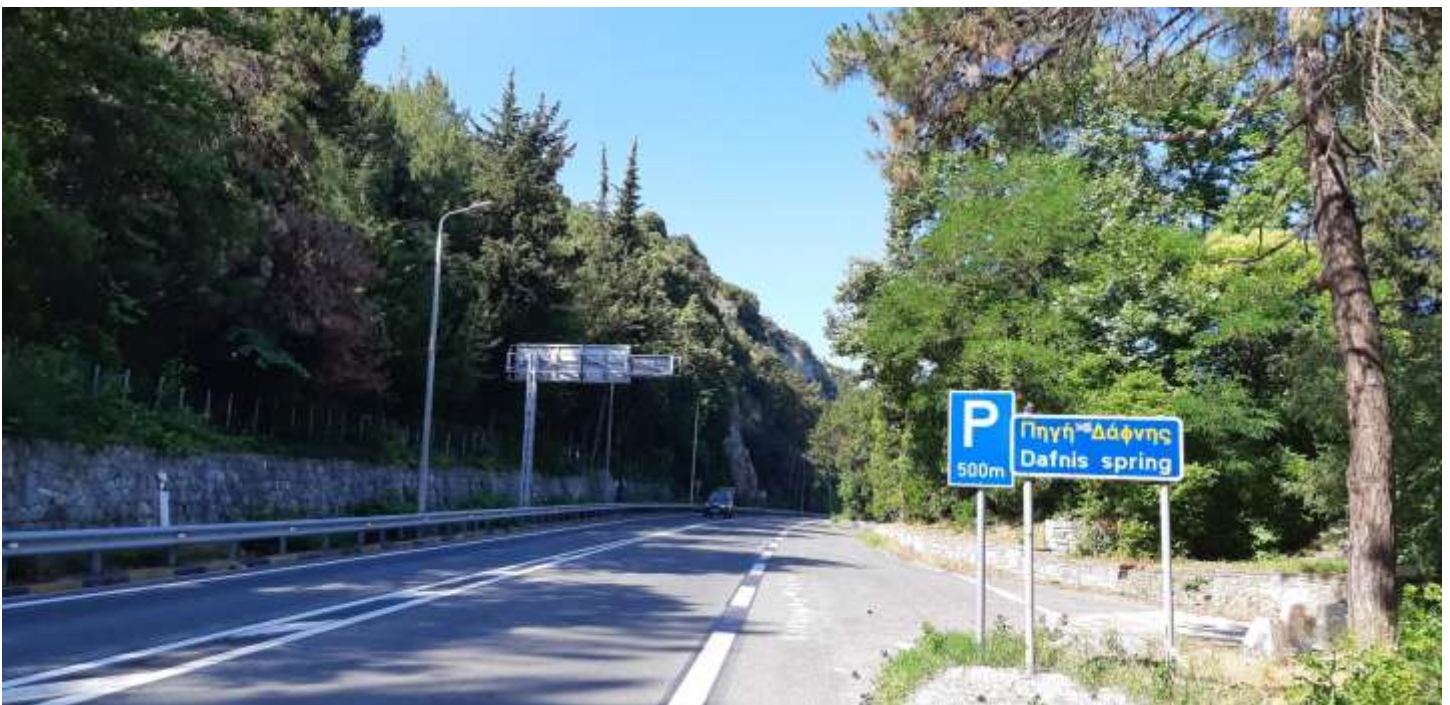
Φωτ. 34.2 : Τμήμα 34 – Μετά τις εργασίες προστασίας (Ιούνιος 2021)