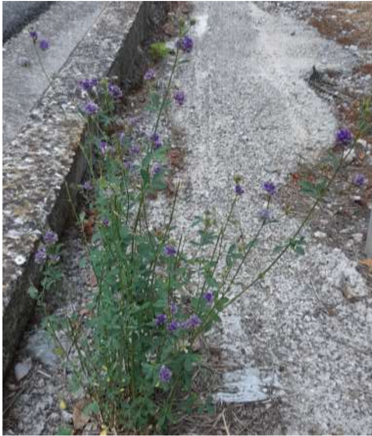
Φωτ.26 Το είδος Medicago sativa L.