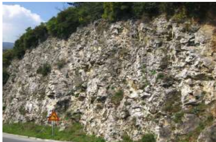
Φωτ. 3.1 : Τμήμα 3 - Πριν τις εργασίες προστασίας (Νοέμβριος 2009)