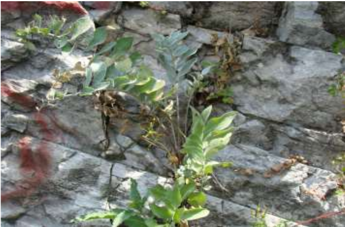
Φωτ.3 Το σπάνιο ενδημικό είδος Centaurea graeca ssp. Seccariana σε οικότοπο 8216 (Ασβεστολιθικά πρηνή με χασμοφυτική βλάστηση)