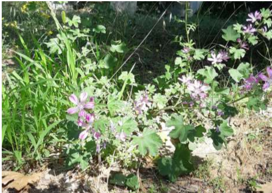
Φωτ.29 Το είδος Malva sylvestris L.