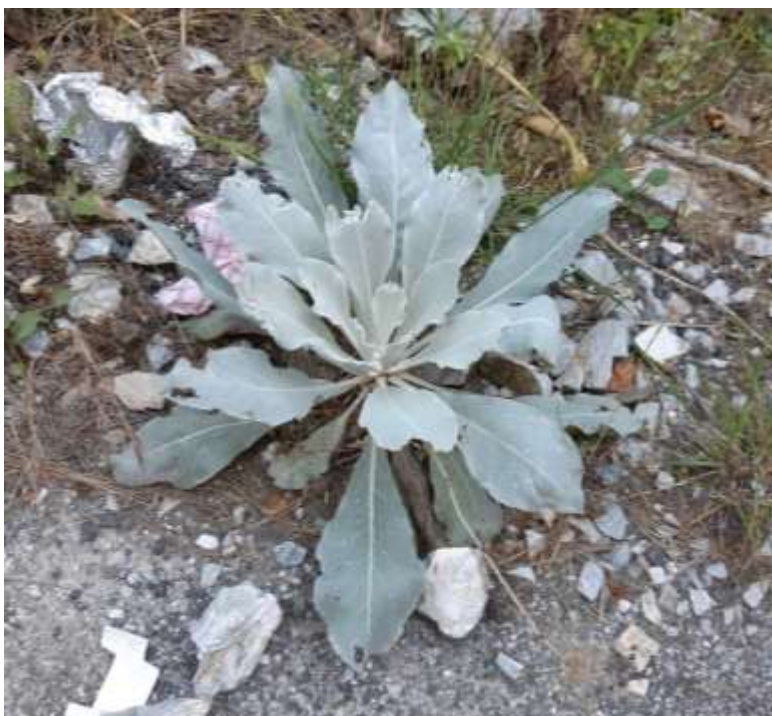
Φωτ.23 Το είδος Verbascum Thapsus .