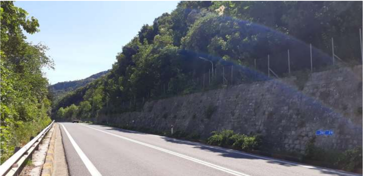
Φωτ. 20.2: Τμήμα 20 – Μετά τις εργασίες προστασίας (Ιούνιος 2021)