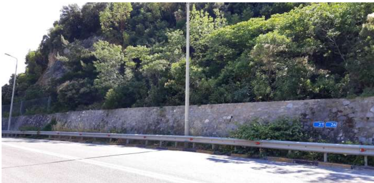
Φωτ. 27.2 : Τμήμα 27 – Μετά τις εργασίες προστασίας (Ιούνιος 2021)