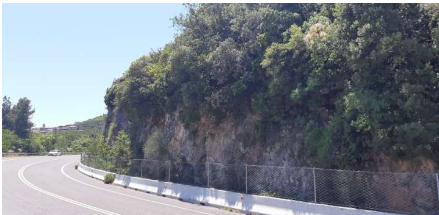
Φωτ. 5.2 : Τμήμα 5 - Μετά τις εργασίες προστασίας (Ιούνιος 2021)