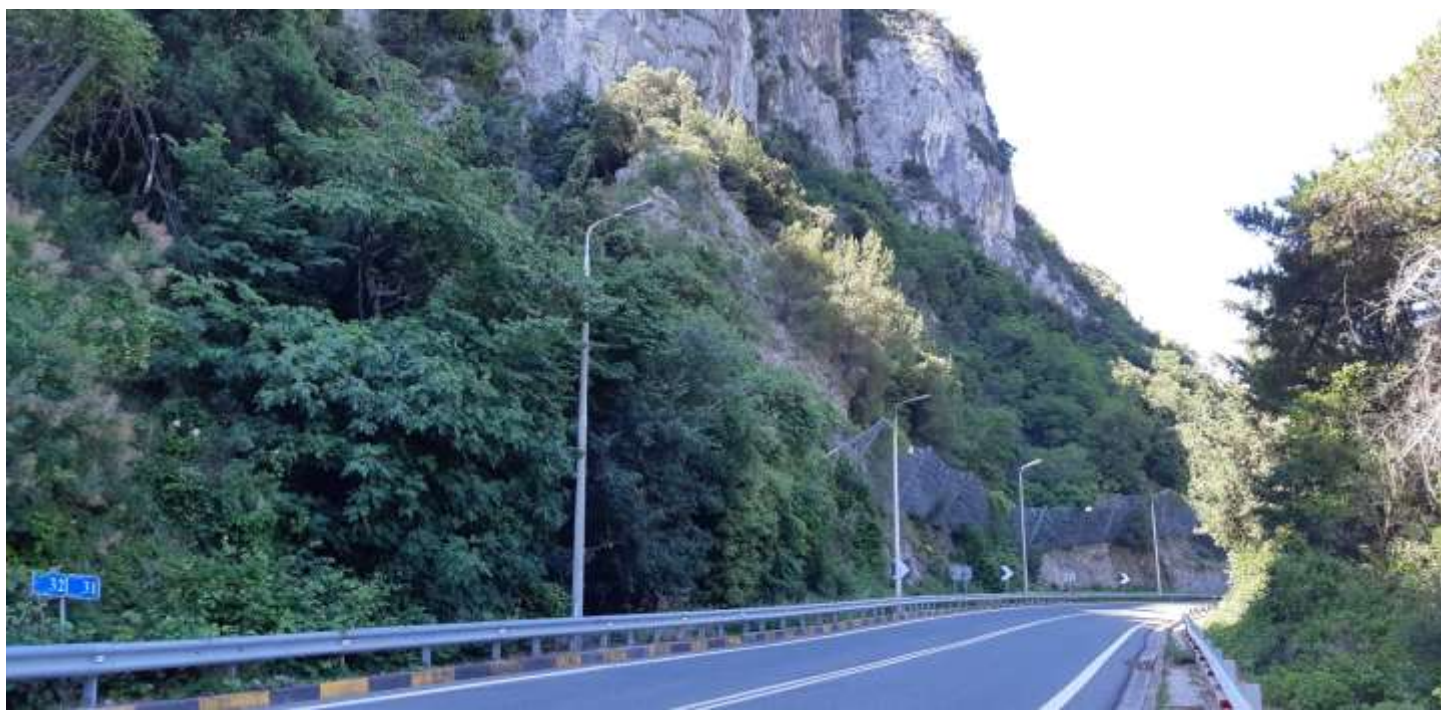
Φωτ. 31.2 : Τμήμα 31 – Μετά τις εργασίες προστασίας (Ιούνιος 2021)

Εκτίμηση (επιτόπια επιθεώρηση 16.6.2021): Σταθερή φυτική μάζα. Εμφάνιση αναρριχώμενων ειδών στα βραχώδη πρανή ( Parthenocissus quinquefolia , Calystegia sepium ) και ποωδών φυτών Balota acetabulosa , Ptilostema chamaepeuce και Euphorbia characias . Εμφάνιση αρκετών ατόμων των ειδών Sambucus ebulus , Medicago sativa , Allium heldreichii και Lilium candidum στα πρανή του Πηγειού.