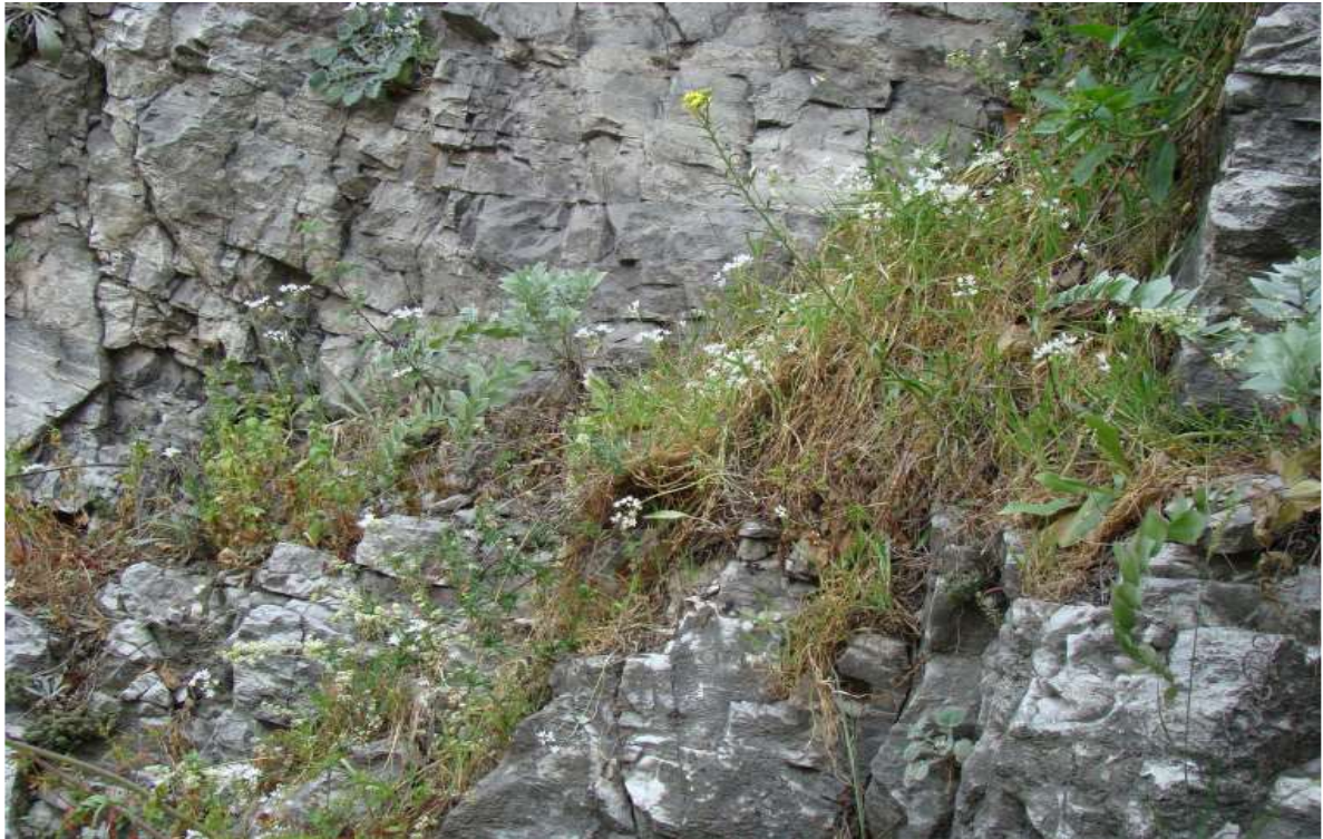
Φωτ.1 Ασβεστολιθικά βραχώδη πρνή με χασμοφυτική βλάστηση (τύπος οικοτόπου 8216)