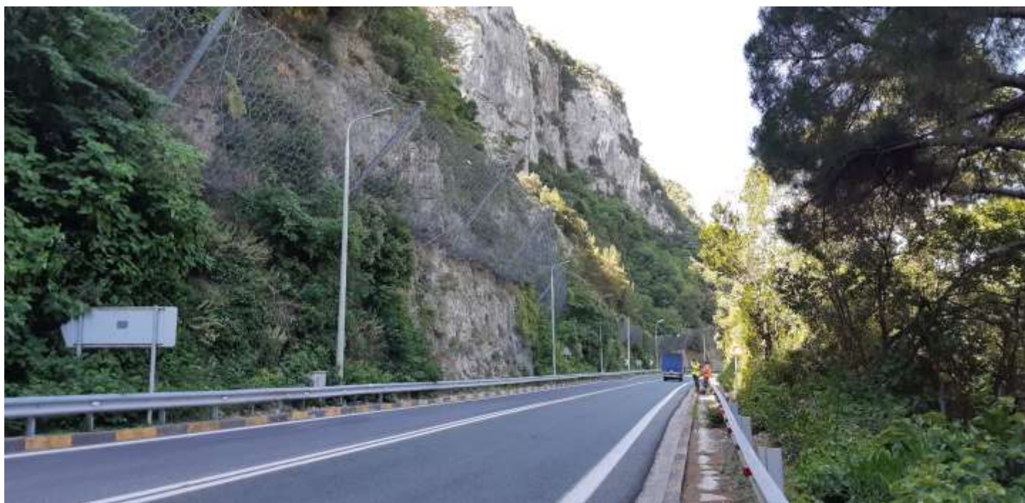
Φωτ. 32.2 : Τμήμα 32 – Μετά τις εργασίες προστασίας (Ιούνιος 2021).