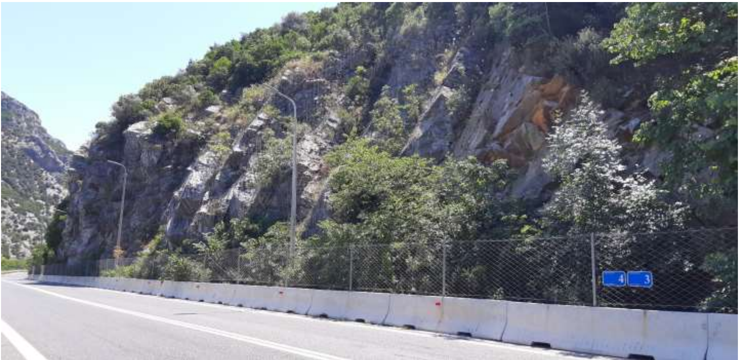
Φωτ. 4.2 : Τμήμα 4 – Μετά τις εργασίες προστασίας (Ιούνιος 2021)