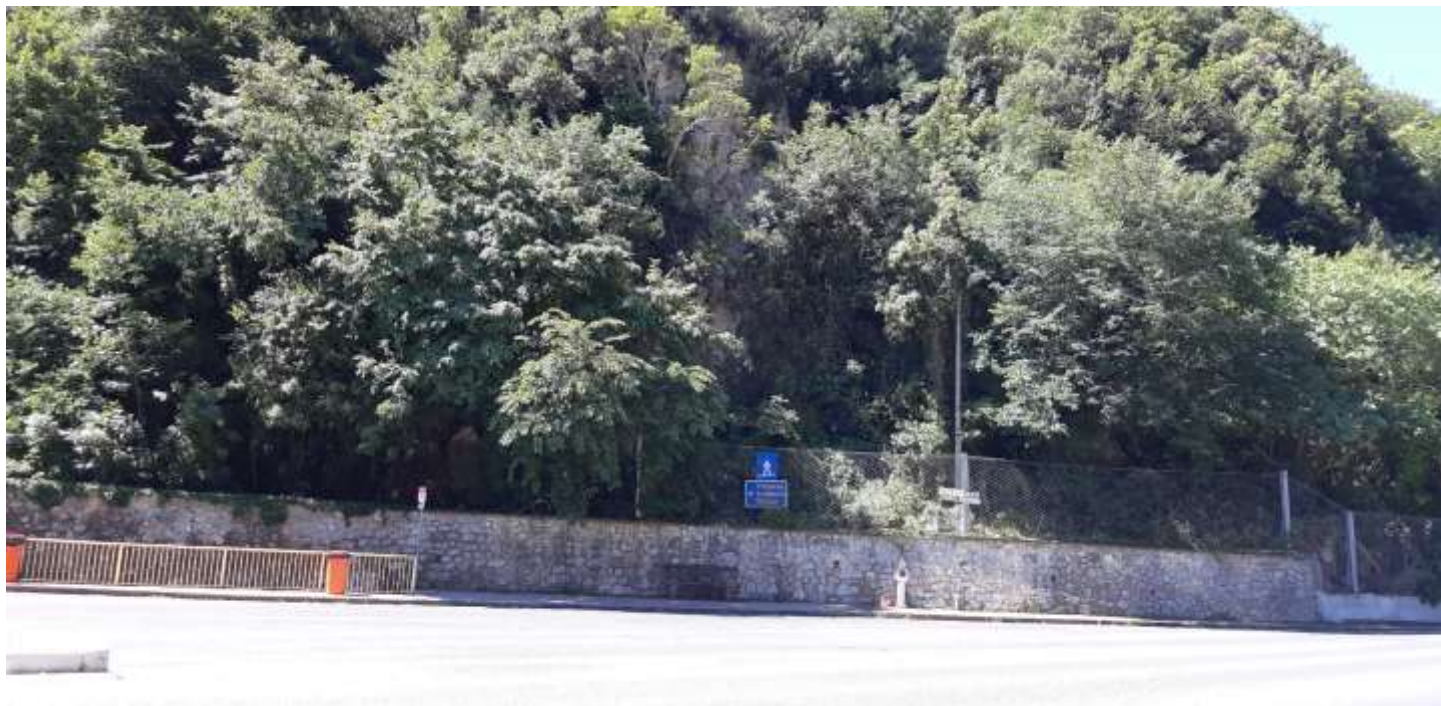
Φωτ. 15.2 : Τμήμα 15 – Μετά τις εργασίες προστασίας (Ιούνιος 2021)