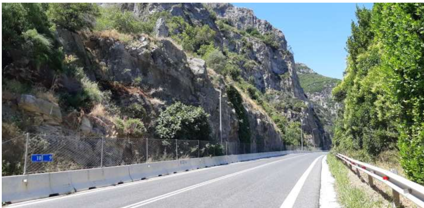
Φωτ. 9.2: Τμήμα 9 – Μετά τις εργασίες προστασίας (Ιούνιος 2021)