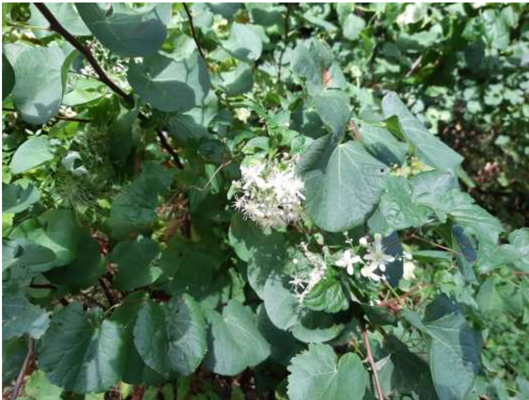
Φωτ.13 Το αναρριχώμενο είδος Clematis vitalba .