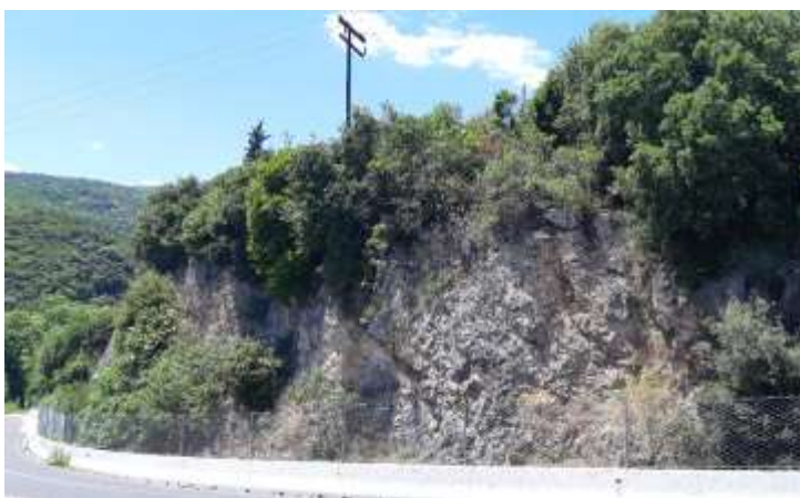
Φωτ. 3.3 : Τμήμα 3 – Μετά τις εργασίες προστασίας (Ιούνιος 2021)