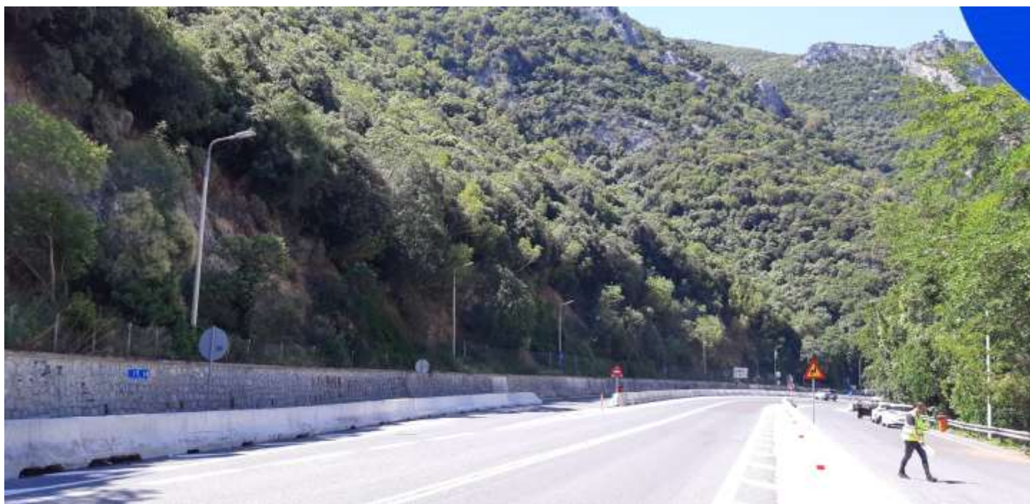
Φωτ. 16.2 : Τμήμα 16 – Μετά τις εργασίες προστασίας (Ιούνιος 2021)