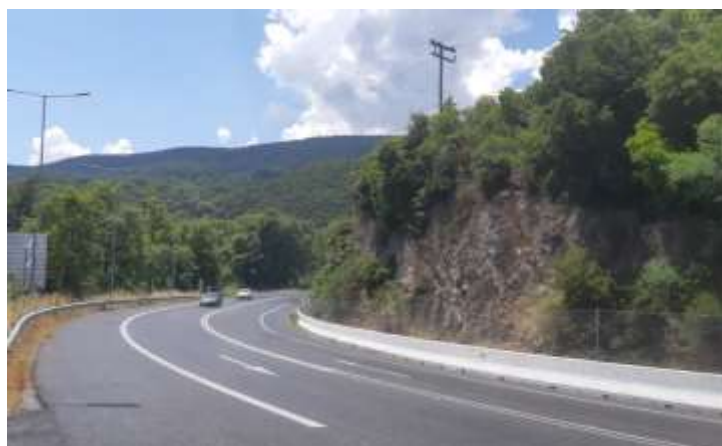
Φωτ. 3.2 : Τμήμα 3 - Μετά τις εργασίες προστασίας (Ιούνιος 2020)