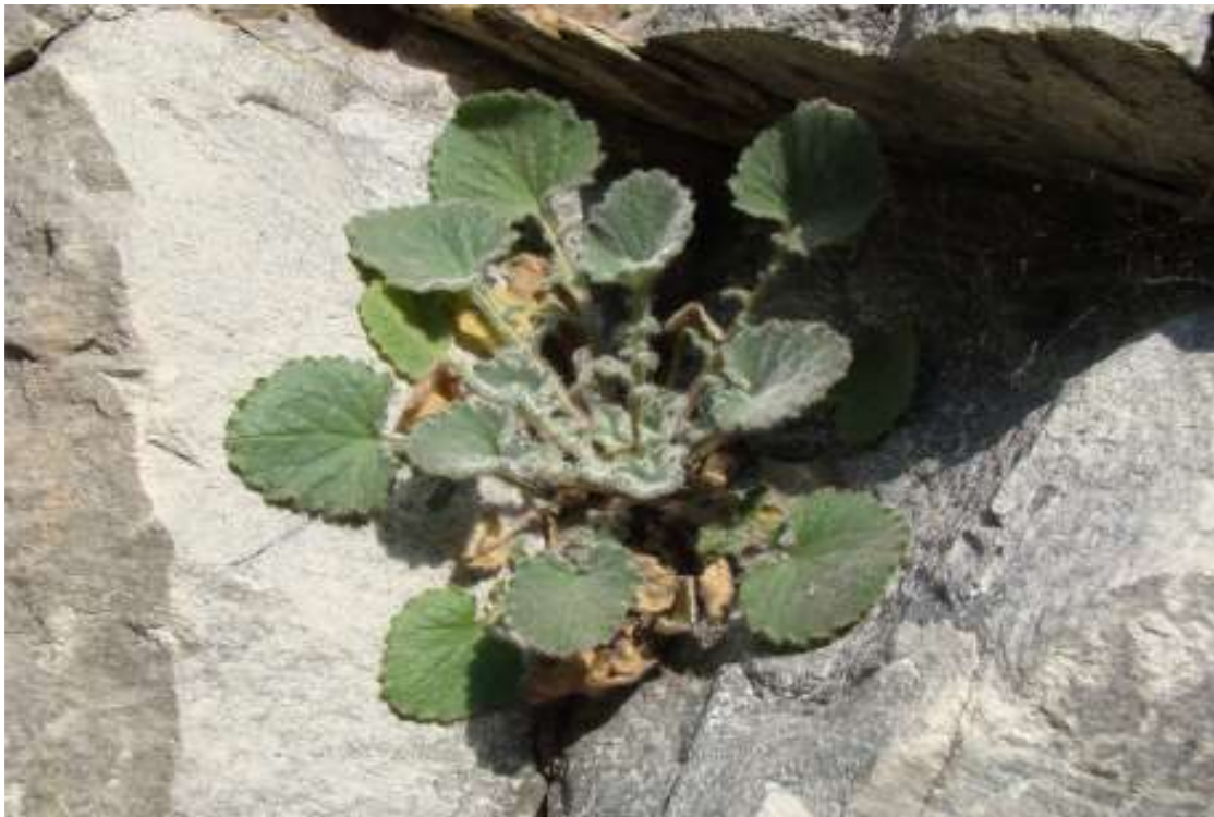
Φωτ.9 Το ενδημικό είδος Campanula thessala