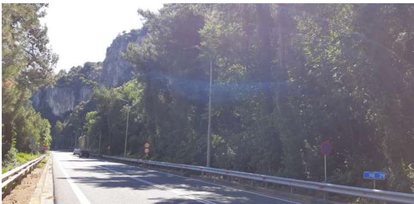
Φωτ. 30.2 : Τμήμα 30 – Μετά τις εργασίες προστασίας (Ιούνιος 2021)