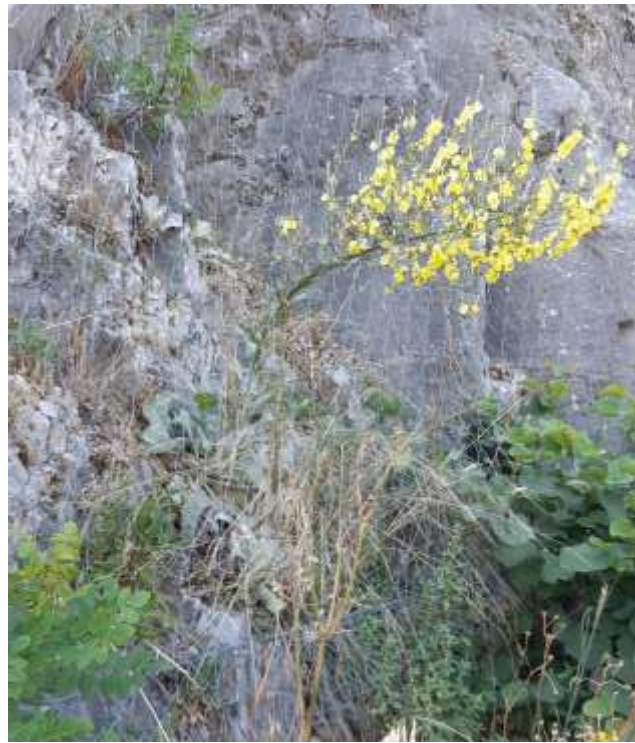
Φωτ.20 Το είδος Verbascum sinuatum στα ερείσματα του δρόμου(αριστερά) και στα βραχώδη πρανή (δεξιά).